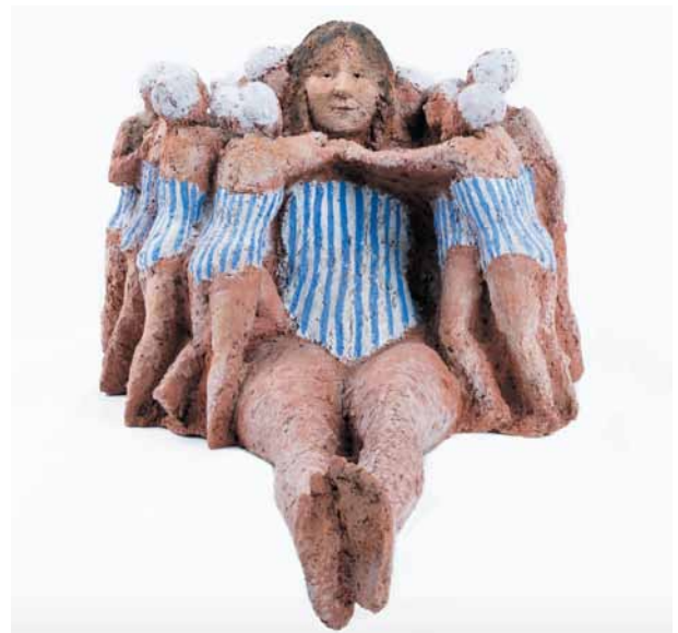
Mady Andrien, Mes chères baigneuses , 2016 © Musée des Beaux-Arts de Liège

Die Ausstellung ist eine nach Themen organisierte Retrospektive mit rund siebzig Skulpturen aus Terrakotta oder Metall, ergänzt durch einige Collagen und Kohlezeichnungen, die eine Schaffenszeit von über fünfzig Jahren präsentieren.