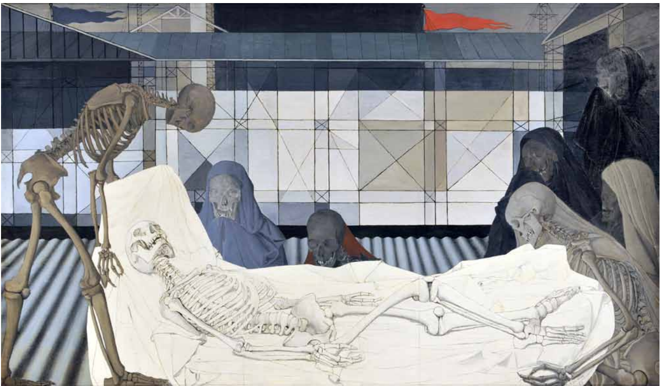
Paul Delvaux, La mise au tombeau , 1953.

Erstaunlicherweise entstanden die vier Werke innerhalb eines sehr kurzen Zeitraums, zwischen 1909 und 1915, was vom Interesse des Sammlers für die zu Beginn des 20. Jahrhunderts neu aufkommenden Avantgarde-Stilrichtungen zeugt: Den Kubismus, den Futurismus und den russischen Suprematismus. Die zwei Werke von Malewitsch schließen eine große Lücke in den