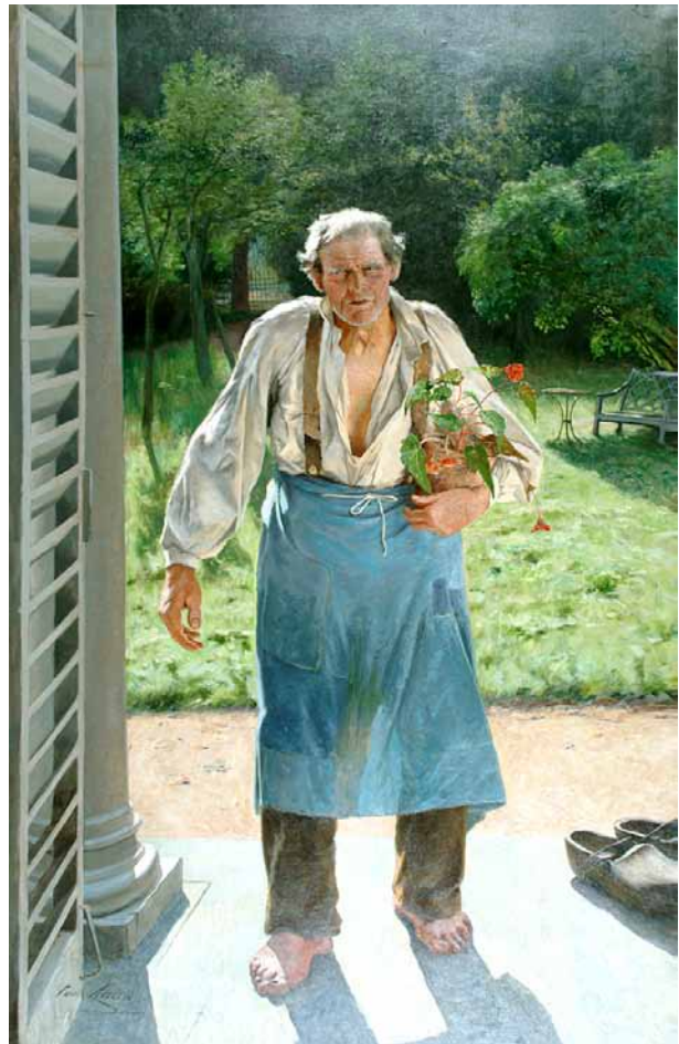
Emile Claus, Le vieux jardinier , vers 1886 © Ville de Liège

Ziel der Ausstellung Liège. Chefs-d'œuvre (Lüttich. Meisterwerke) ist es also, einen Dialog zwischen den Epochen und den formalen Bewegungen herzustellen – nicht ohne dabei den Besuchern besondere Schwerpunkte auf bestimmten Künstlern und künstlerischen Strömungen anzubieten. Von Auguste Donnay, Rik Wouters mit seinem Talent für Licht, dem schwer fassbaren James Ensor, Pol Bury und seinen mobilen Skulpturen über das Entstehen der Metallindustrie im Lütticher Becken aus der Sicht von Künstlern des 20. und 21. Jahrhunderts bis hin zur Bewegung Cobra. Bestimmte Meisterwerke verlassen nur ausnahmsweise den Tresor: Les Femmes vertueuses von Lambert Lombard, ein Ensemble aus Statuen und Bozzetti des barocken Bildhauers Jean