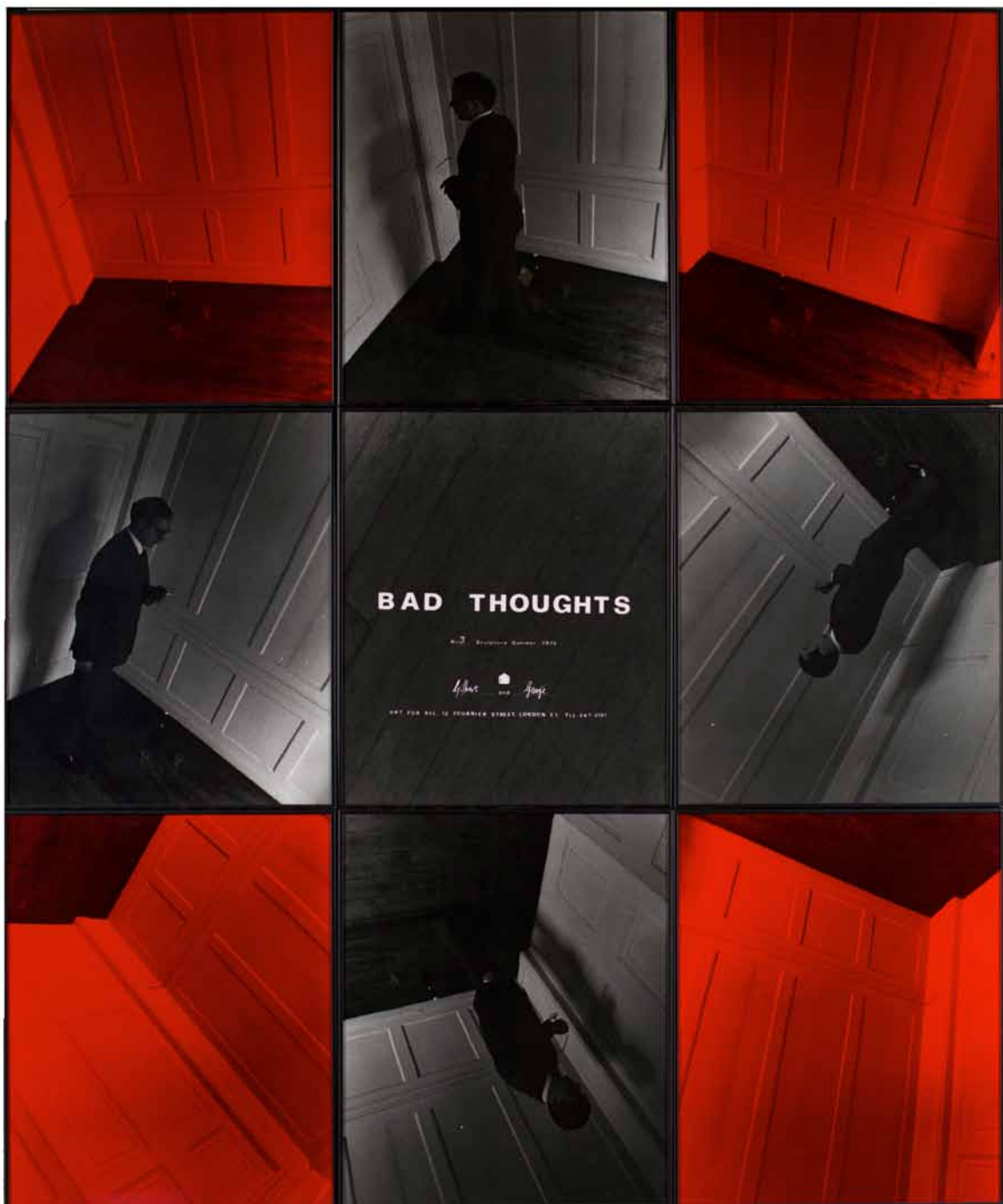
Gilbert and George, Bad Thoughts / N°3, 1975.

schließlich schuf Picasso im Jahr 1909, also zwei Jahre nach seinem Schlüsselwerk Les Femmes d'Alger (O. J. 'M. O.' Version O) und nur sechs Jahre nach unserem Bild La famille Soler (Die Familie Soler) , 1903, das aktuell in der Ausstellung Picasso, bleu et rose (Picasso, blau und rosa) im Pariser Musée d'Orsay präsentiert wird. Mit diesem Werk kann das Museum den Kubismus würdigen, eine Kunstrichtung, die die Kunstgeschichte zu Beginn des 20. Jahrhunderts revolutionierte“, so die Konservatorin abschließend.