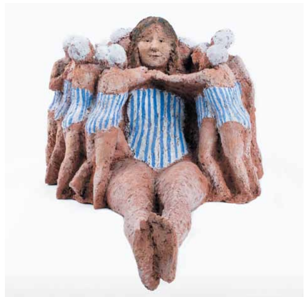
Mady Andrien, Mes chères baigneuses , 2016 © Musée des Beaux-Arts de Liège

De thematische retrospectieve tentoonstelling bestaat uit een zeventigtal beeldhouwwerken van klei of metaal, aangevuld met enkele collages en houtskoolschetsen. Een overzicht van meer dan vijftig jaar als kunstenaar.