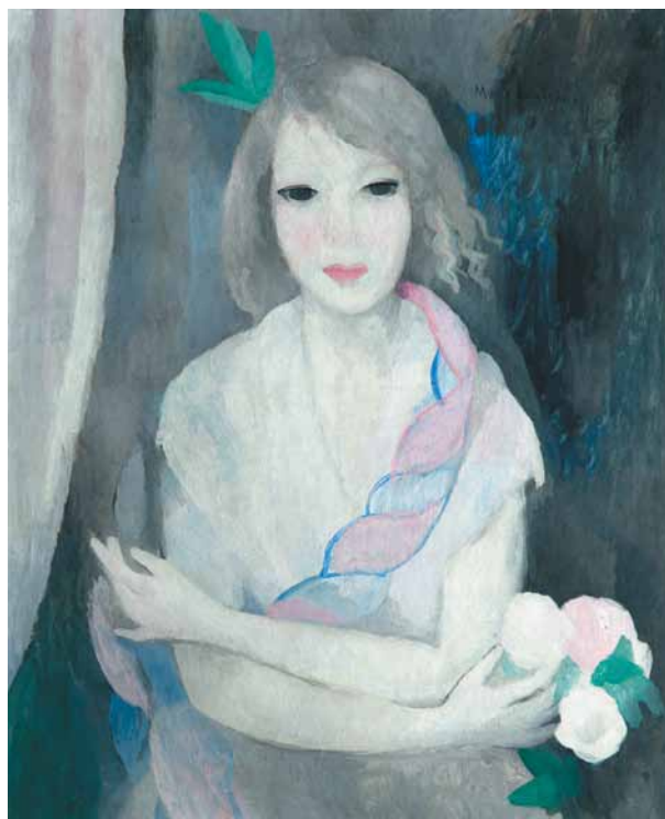
Marie Laurencin, Portrait de jeune fille , 1924