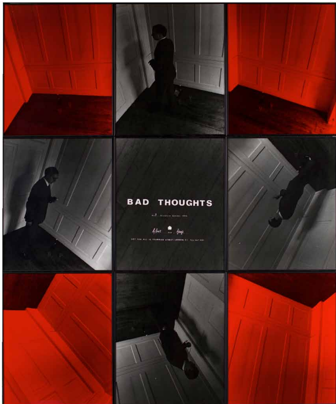
Gilbert and George, Bad Thoughts / N°3, 1975.

Ten slotte hebben we het doek Deux têtes (Twee hoofden) dat in 1909 door Picasso werd geschilderd, twee jaar na zijn baanbrekende werk Les Femmes d'Alger (O. J. Version O) ( De jongedames van Avignon ), en slechts zes jaar na ons schilderij La famille Soler (De familie Soler) (1903) dat momenteel deel uitmaakt van de tentoonstelling Picasso, bleu et rose in het Musée d'Orsay in Parijs. Met dit werk heeft het museum een voorbeeld van het kubisme, een beweging die de kunstgeschiedenis aan het begin van de twintigste eeuw revolutioneerde», besluit de conservatrice.