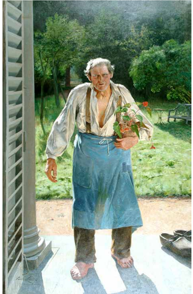
Emile Claus, Le vieux jardinier , vers 1886

De tentoonstelling Luik. Meesterwerken wil zo een dialoog opzetten tijdens verschillende tijdperken en stromingen, niet zonder de bezoeker een bijzondere focus voor te stellen, op sommige kunstenaars en artistieke stromingen: het lumineuze talent van Rik Wouters, variaties op het thema van het stilleven of ook nog een bijzondere aandacht voor Cobra en een evocatie van het ijzerbekken van Luik doorheen de blik van kunstenaars in de 20e en 21e eeuw.