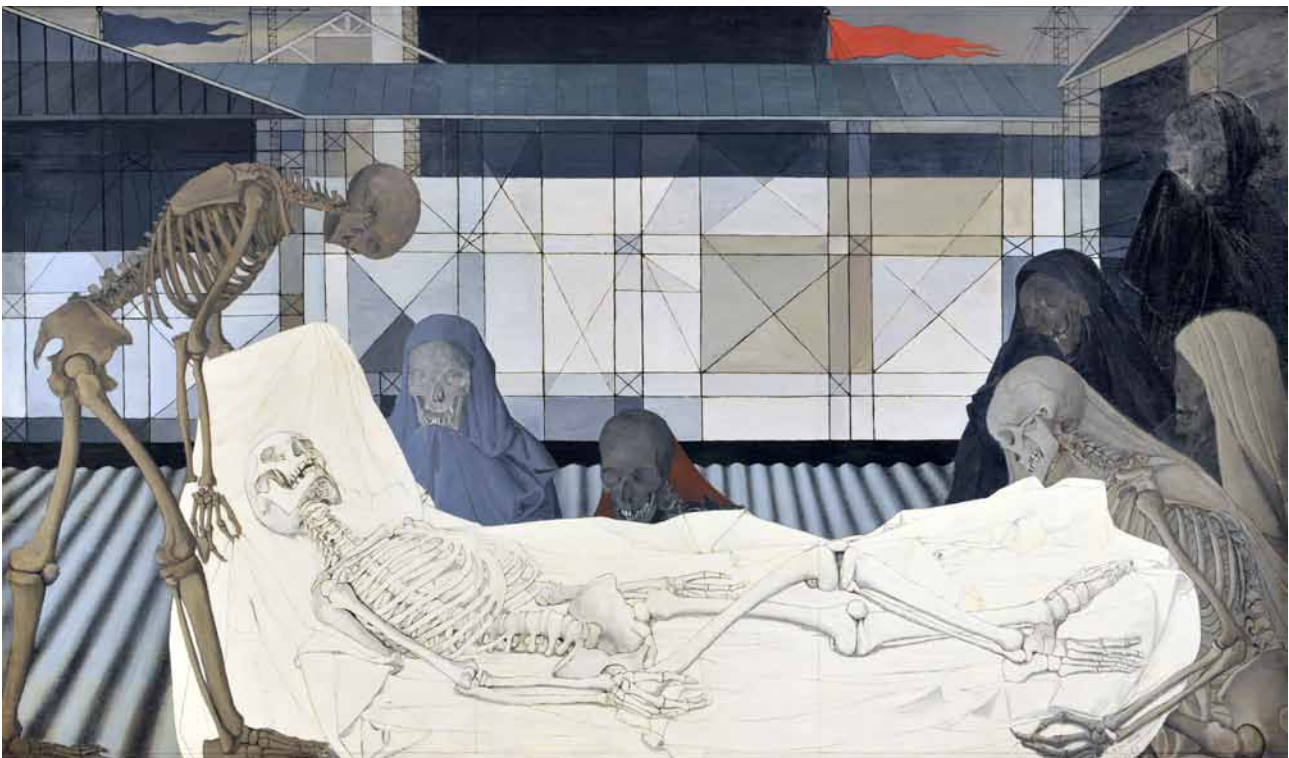
Paul Delvaux, La mise au tombeau, 1953.

Verrassend is dat de vier werken stammen uit dezelfde, zeer korte periode, 1909-1915. Ze zijn getuige van de interesse van de verzamelaar