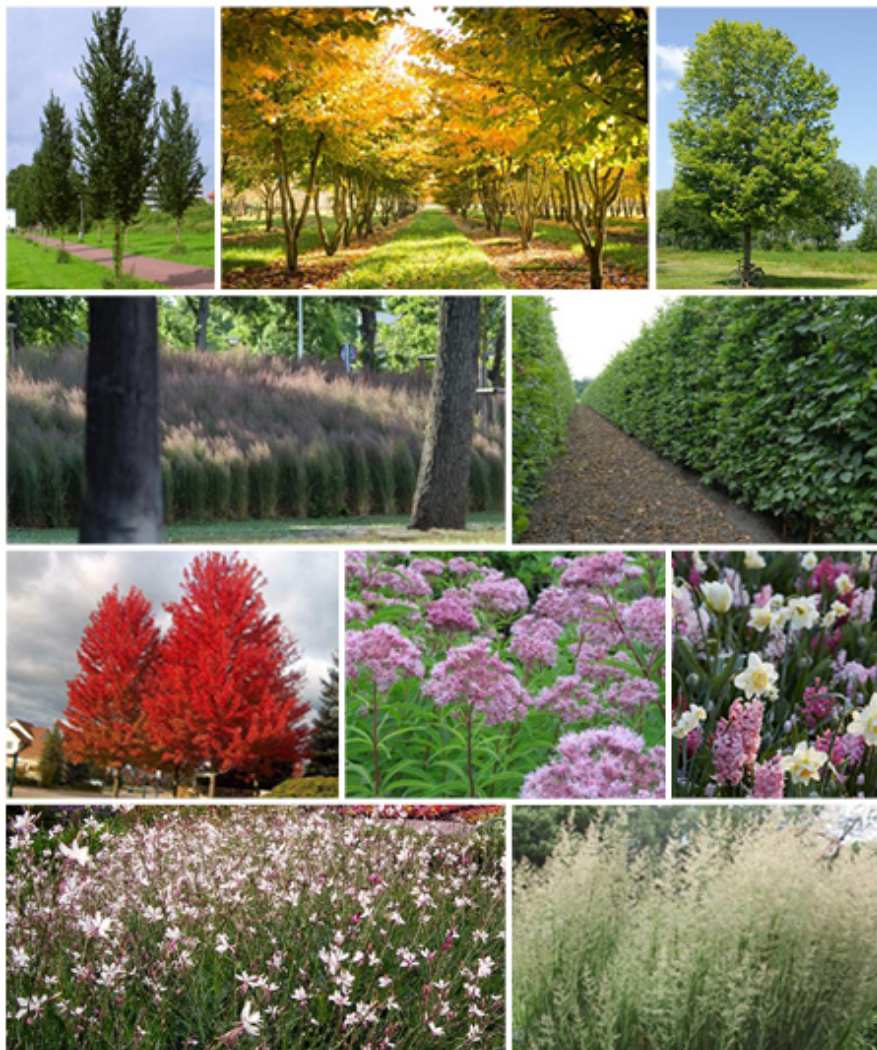
Illustration d'une partie de la palette végétale qui verdira le quartier

Des arbres de gros calibres, des bacs de végétaux, des parterres et des pelouses vont constituer le paysage végétal de la rue des Bonnes Villes et du boulevard de la Constitution. Tout arbre abattu pour les besoins de transformation du quartier ou en raison de maladies sera replanté en nombre équivalent. A l'issue des travaux de réaménagement, le boulevard de la Constitution va prendre la forme d'une véritable colonne vertébrale verte dans le quartier d'Outremeuse. La rue des Bonnes Villes quant à elle sera ponctuée d'un double alignement d'arbres qui seront plus nombreux qu'actuellement et disposés dorénavant de part et d'autre de la voirie.