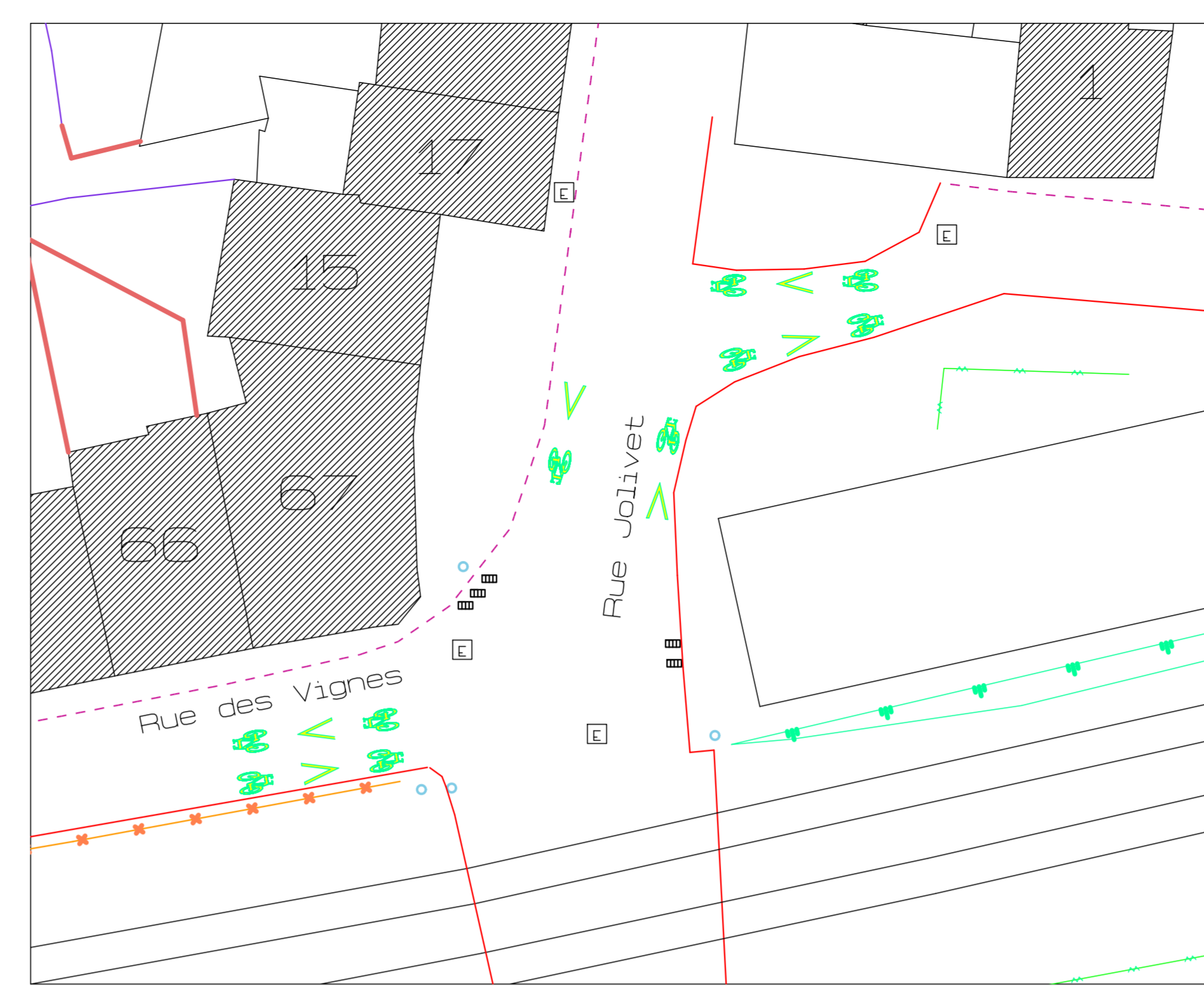
rue des Vignes – Site C