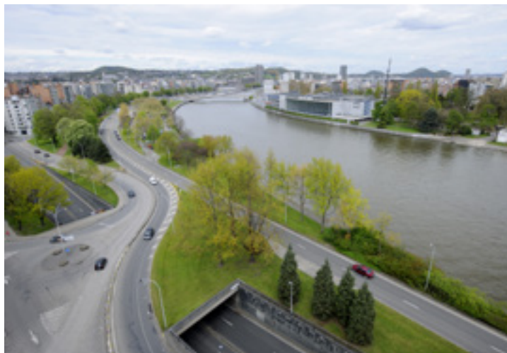
Situation avant travaux