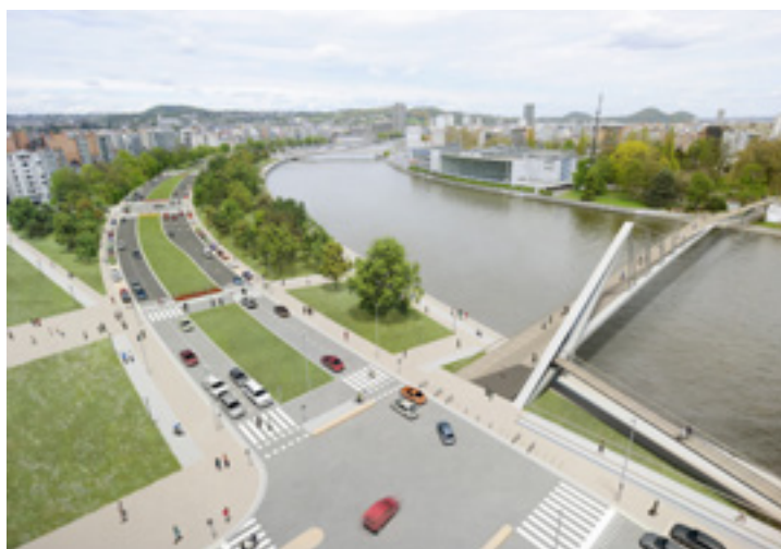
Situation après travaux