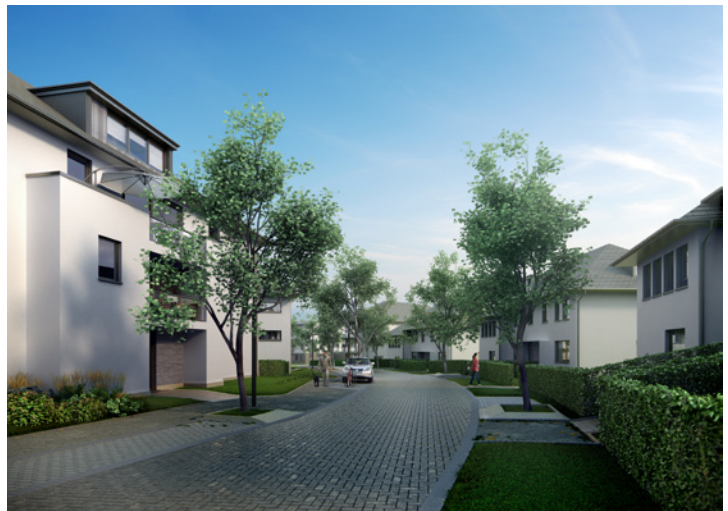
Exemple de réalisation : «Bella Vita» © Architectes : SM «FCM Architects - Baudoin Courtens & Associés»