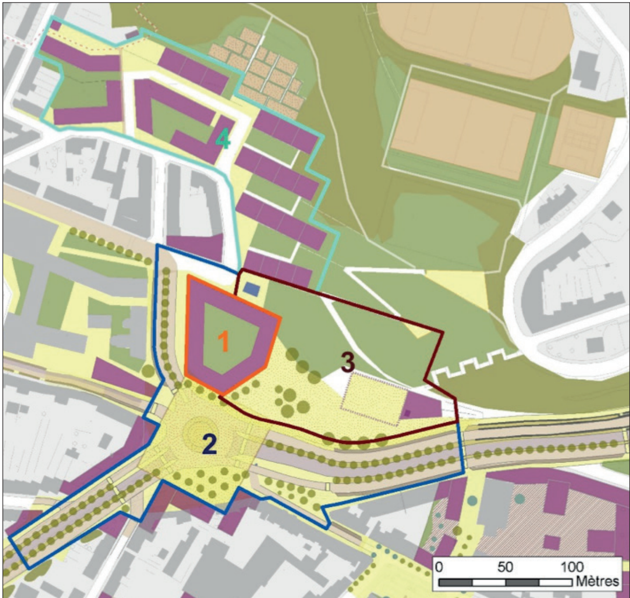
Programmation Fontainebleau 2030. Extrait du dossier de rénovation urbaine.