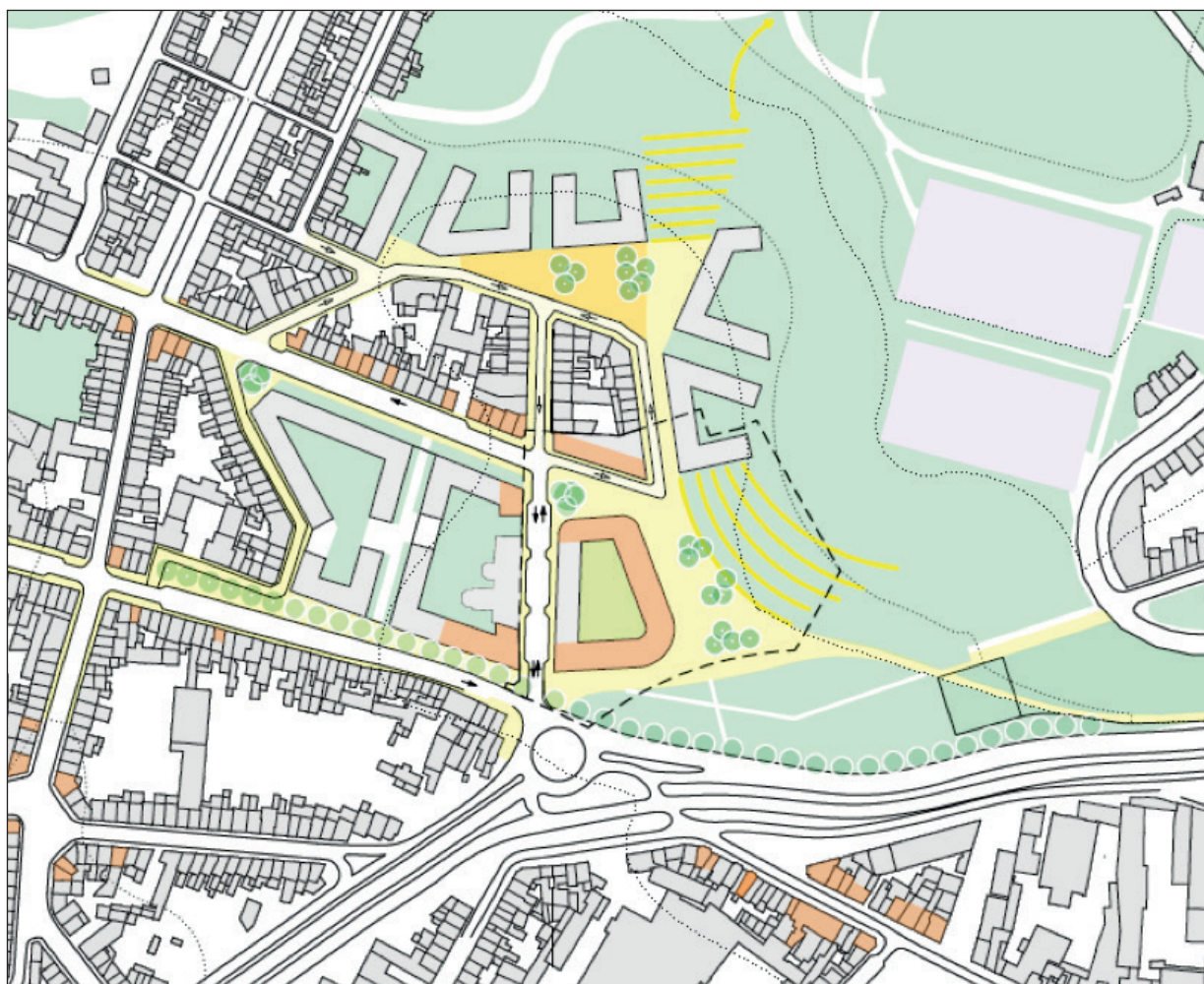
Les premières intentions du Masterplan.

Sur cette base, le Collège initiera d'ailleurs en 2022 un appel à projets pour la reconstruction de l'îlot « Légia ».