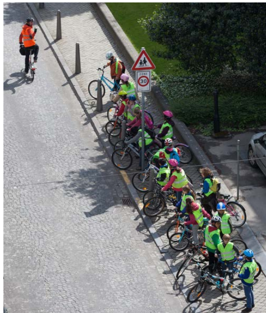
Formation des élèves à l'athénée Léonie de Waha.